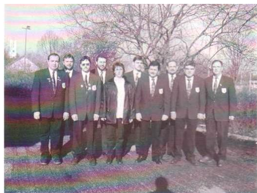
Vorstandschaft im Jubiläumsjahr